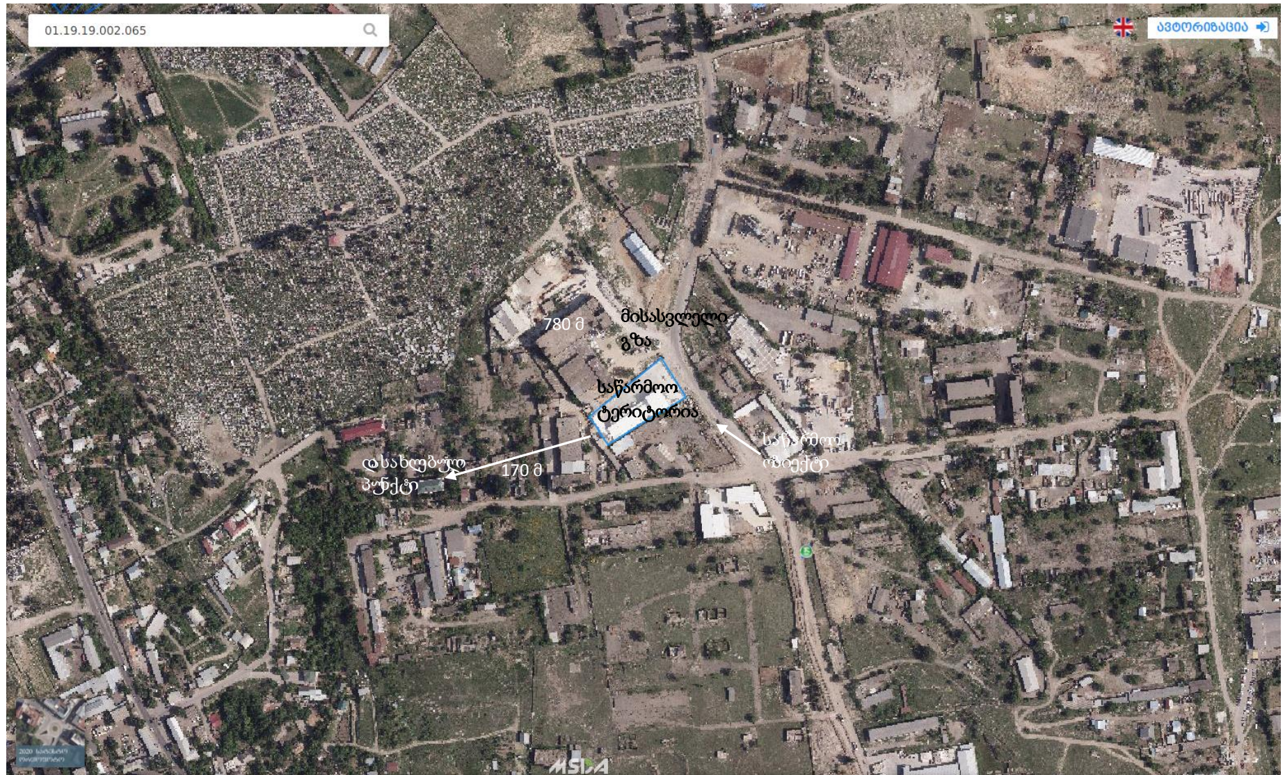
სურ.1 - საწარმოს განთავსების ტერიტორიის სიტუაციური რუკა.