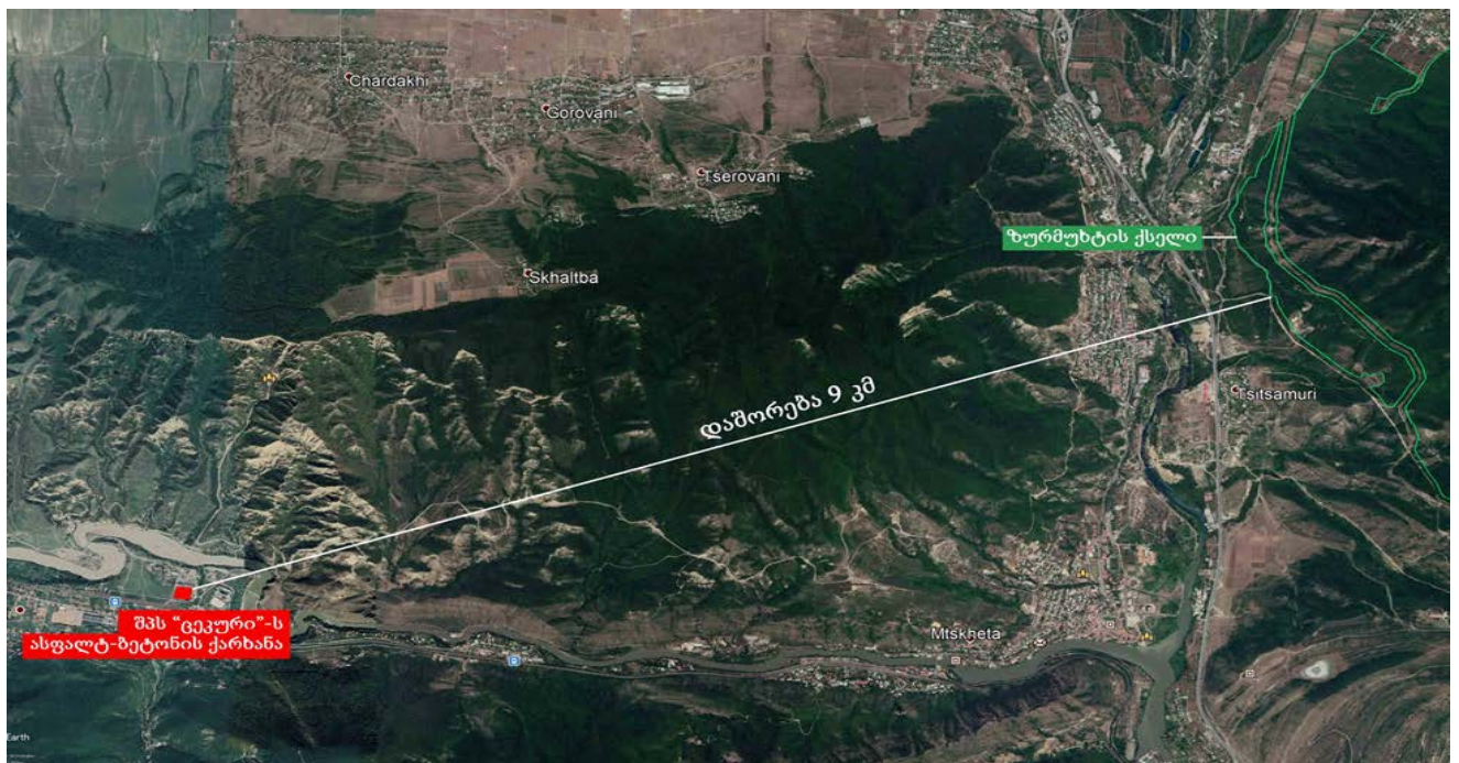
სურათი 4.1 შპს ცეკური“-ს და ზურმუხტის ქსელის დამტკიცებული საიტის „საგურამო“ (GE0000047) ურთიერთგანლაგების სქემა