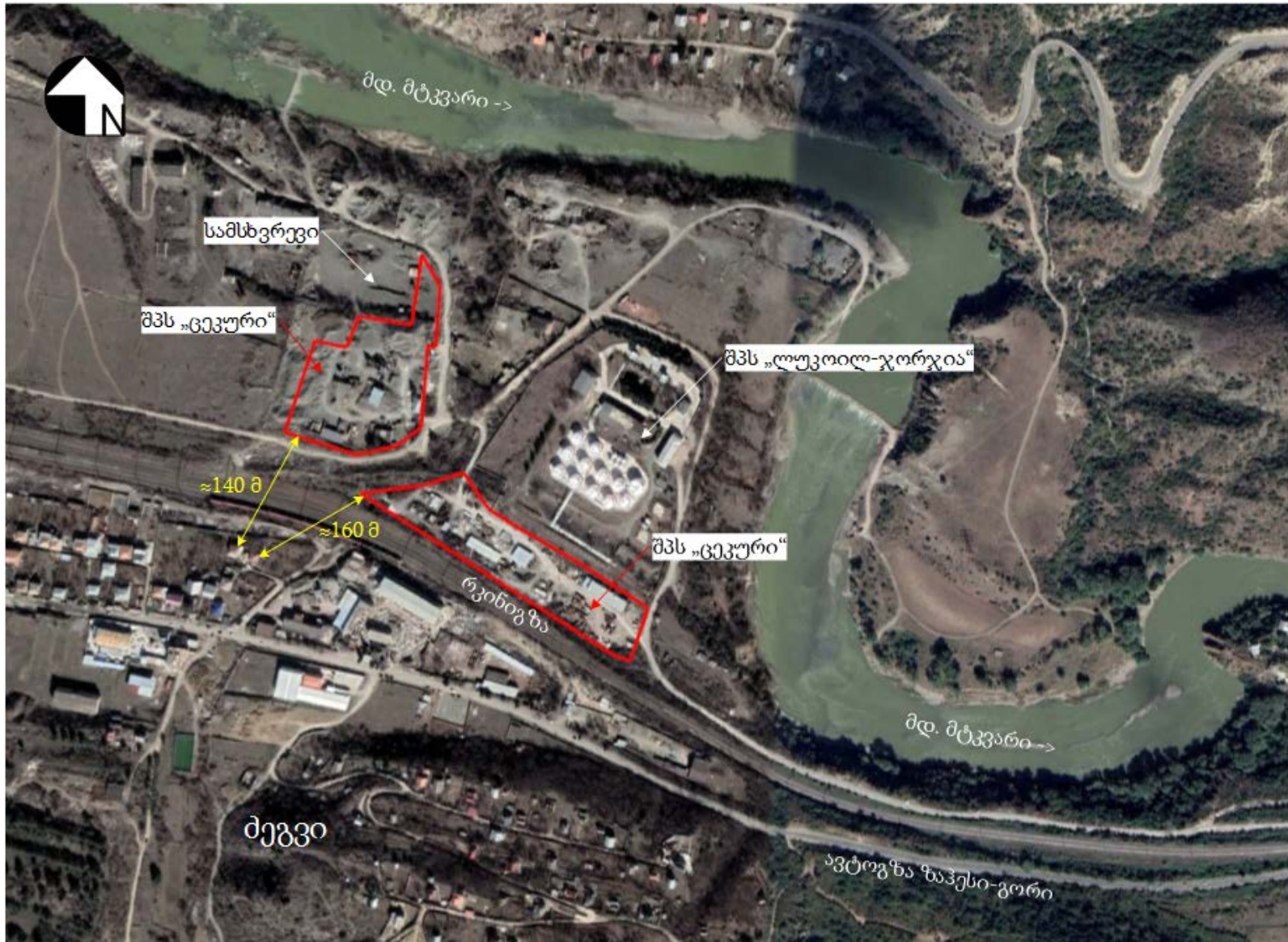
სურათი 3.1.1. ტერიტორიის სიტუაციური სქემა