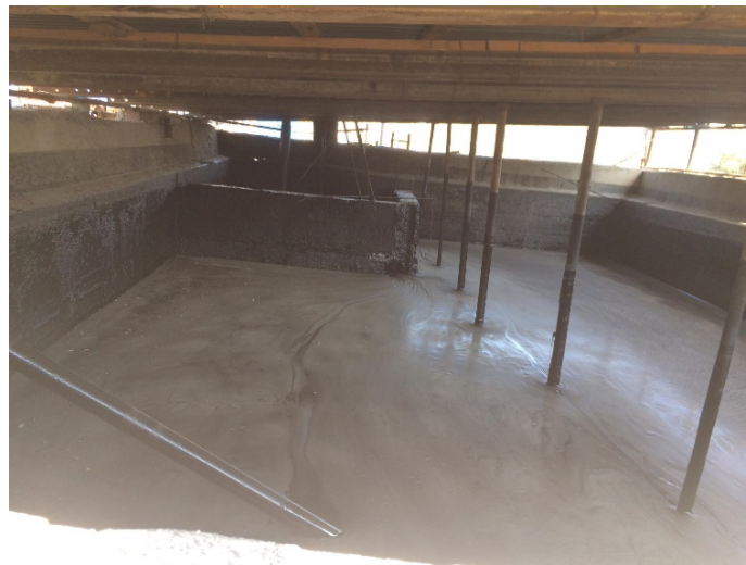
ბიტუმის სამარაგო რეზერვუარი