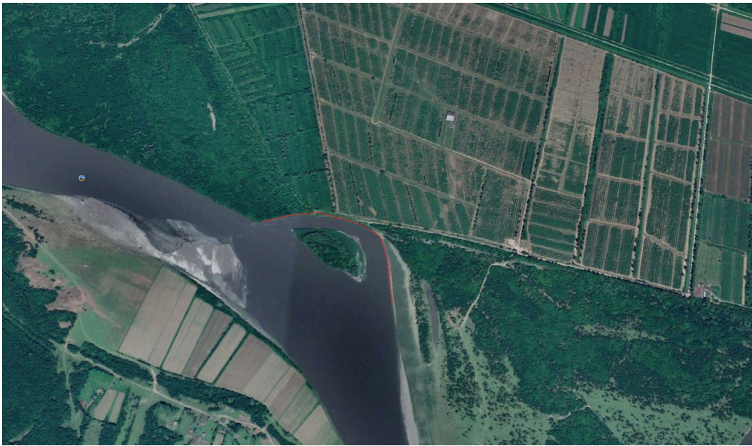
ნახ.1 მდ. რიონის ეროზიული მარჯვენა ნაპირი

როგორც უკვე აღინიშნა დამკვეთის მოთხოვნით საპროექტო ეროზიის საწინააღმდეგო ნაგებობა გაანგარიშებულია 3 % უზურუნველყოფის წყლის ხარჯზე. პროექტით გათვალისწინებულია 420 მ სიგრძის მონაკვეთზე ეროზიის საწინააღმდეგო ქვანაყარი ბერმის მოწყობა. ბერმის თხემის სიმაღლე წყლის არსებული დონიდან ამალელებულია 2,0 მეტრით. მისი სიგანე 12,0 მეტრს შეადგენს, მისი ფერდობების დახრილობა m=1,5 -ს ტოლია.