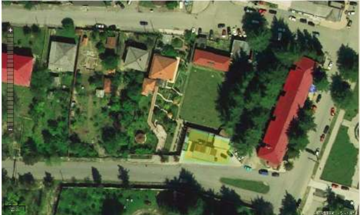
ილუსტრაცია 1საპროექტო ტერიტორიის სიტუაციური რუკა