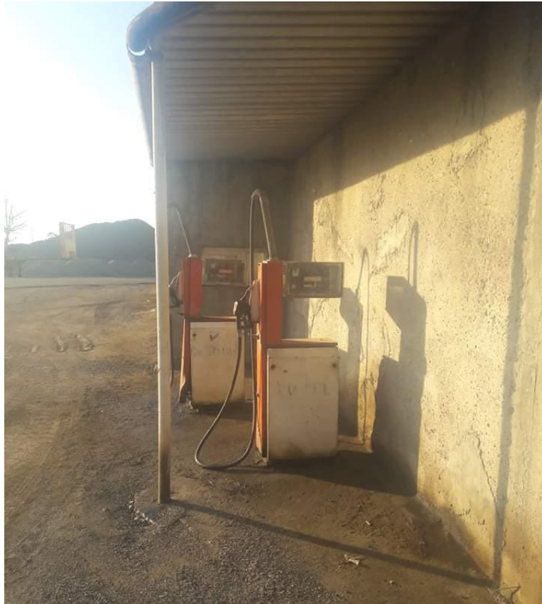
სურ. N 8 - ნავთობპროდუქტების გასაცემი სვეტები

საწვავის დისპენსერები მილსადენების საშუალებით უკავშირდება საწვავის რეზერვუარებს.