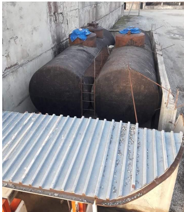
სურ. N 8 - ნავთობპროდუქტების რეზერვუარები

ტერიტორიაზე განთავსებულია ორი დაახლოებით 50 ტონიანი მიწისზედა რეზერვუარი, კერძოდ ერთი 50, 93 ტონიანი და მეორე 50,11 ტონიანი. აღნიშნული რეზერვუარები ოთხივე მხრიდან შემოსაზღვრულია ბეტონის კედლით, რომელიც უზრუნველყოფს ავარიული დაღვრის შემთხვევაში საწვავის დროებით შეკავებას. ორივე რეზერვუარი განკუთვნილია დიზელის საწვავისთვის. რეზერვუარები დაფარულია ანტიკოროზიული ნივთიერებებით. რეზერვუარები დამზადებულია ლითონის ორშრიანი ფურცლით.