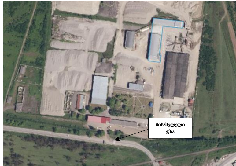
სურ. N 9 - მისასვლელი გზა