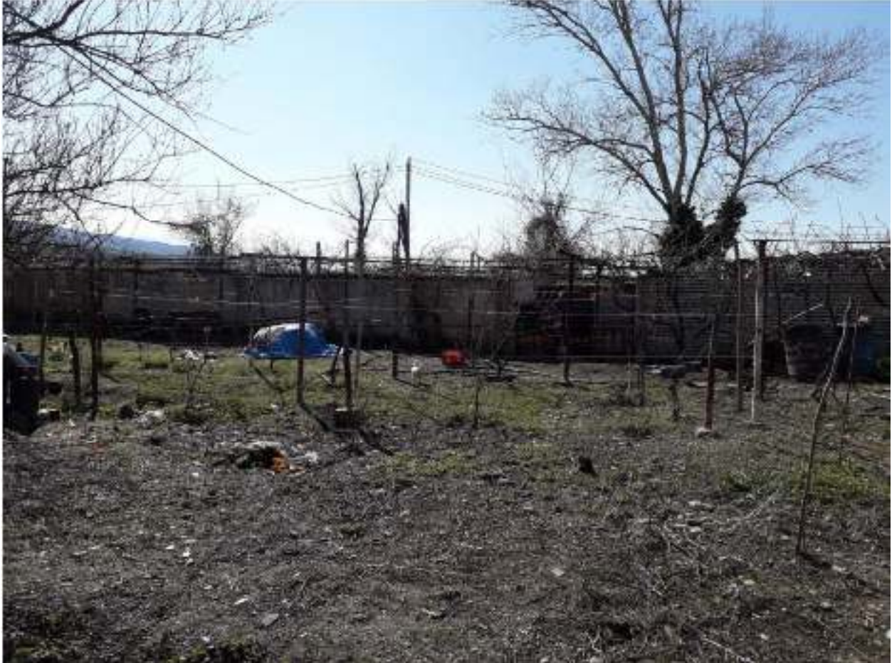
ილუსტრაცია 2 საპროექტო მიწის ნაკვეთი

რაც შეეხება არსებულ სარეზერვუარო პარკს, განხორციელდება არსებული რეზერვუარების დემონტაჟი და ქ. თბილისის აეროპორტის მიმდებარე ტერიტორიაზე, კომპანიის კუთვნილ საწყობში გადატანა.