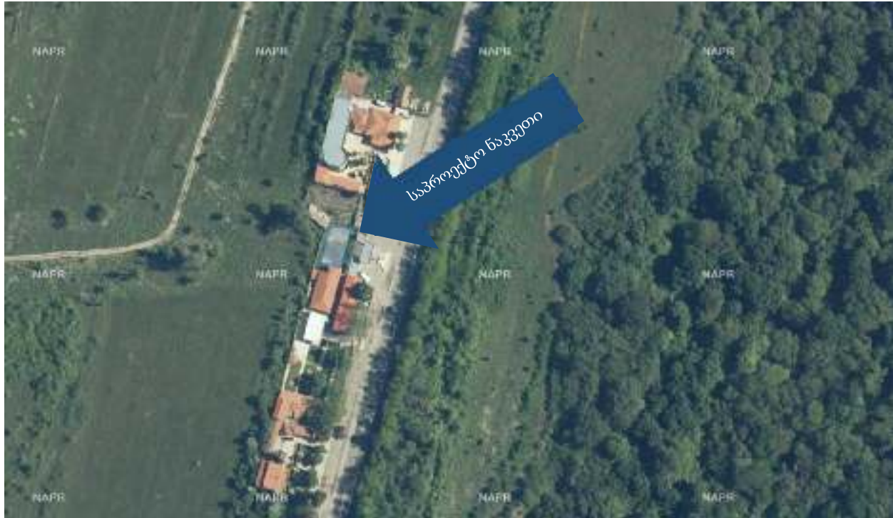
ილუსტრაცია საპროექტო ტერიტორიის სიტუაციური რუკა