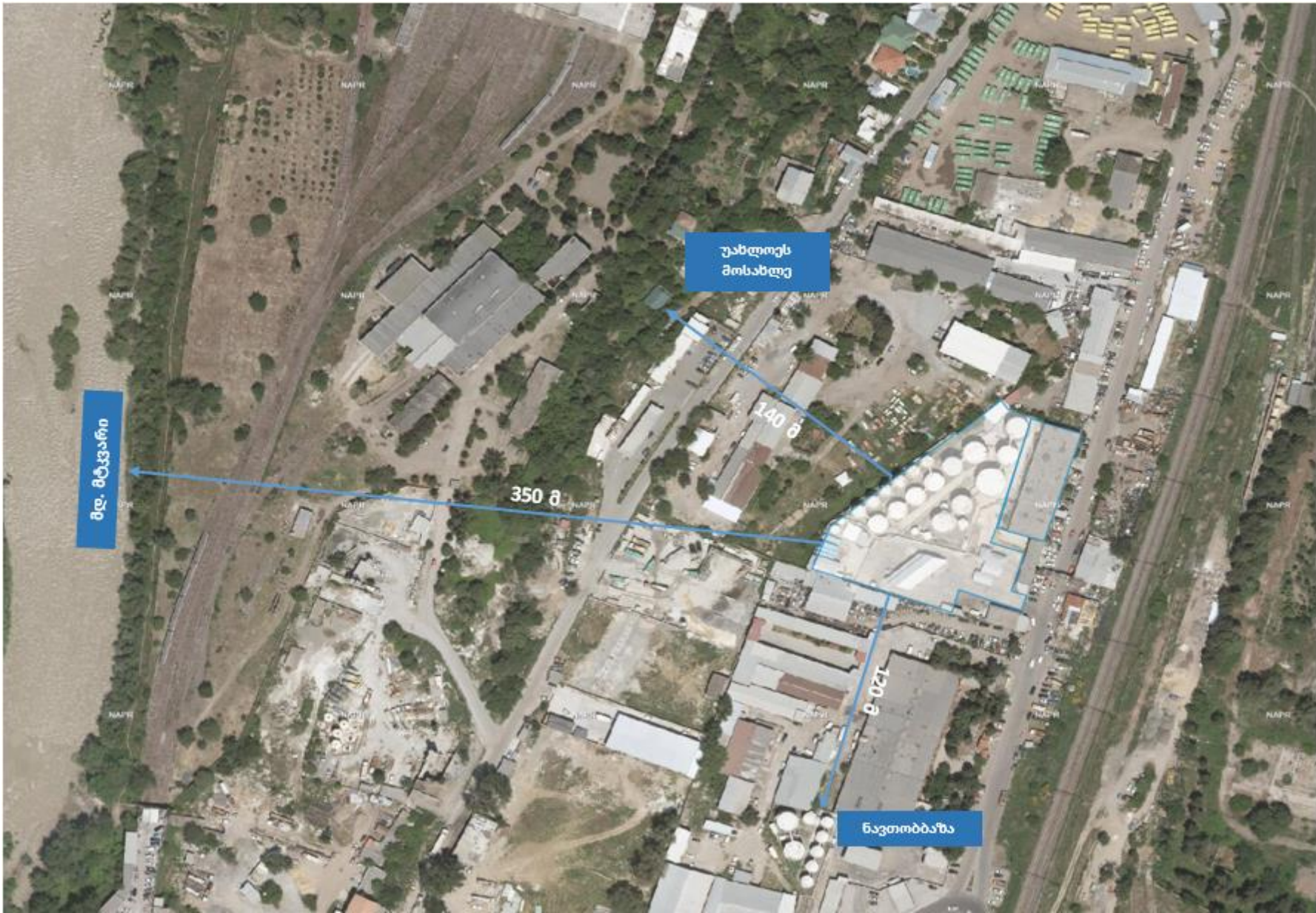
სურ. N 1 - ობიექტის განთავსების სიტუაციური რუკა