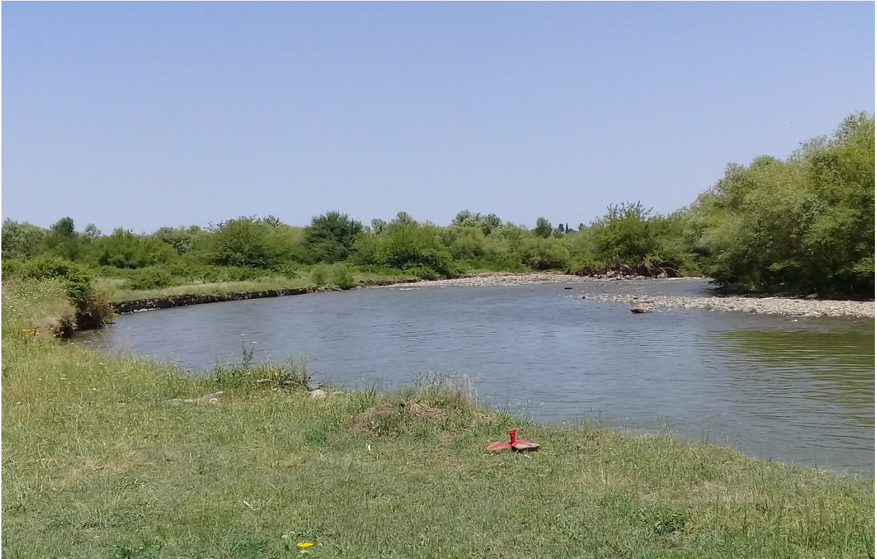
მდინარის ჭალა-კალაპოტის ხედი