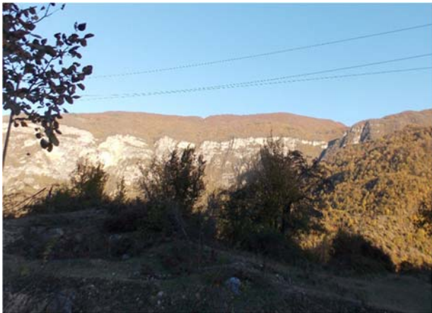
ეგხ-ის დერეფანი სოფ. ორზვის აღმოსავლეთი მდებარე ქედის თხემზე

პროექტირების ამ ეტაპზე შერჩეული დერეფნის ხედები მოცემულია სურათებზე 2.2.1.1.1. აეროფოტოზე დატანილი მარშრუტი ნაჩვენებია ნახაზზე 2.2.2.1.1.