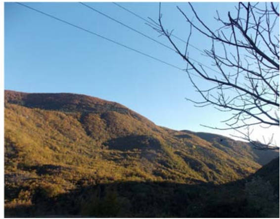
ეგხ-ის დერეფნის ხედი სოფ. ქორენიშის მოპირდაპირე ქედის ზედა ნიშნულზე