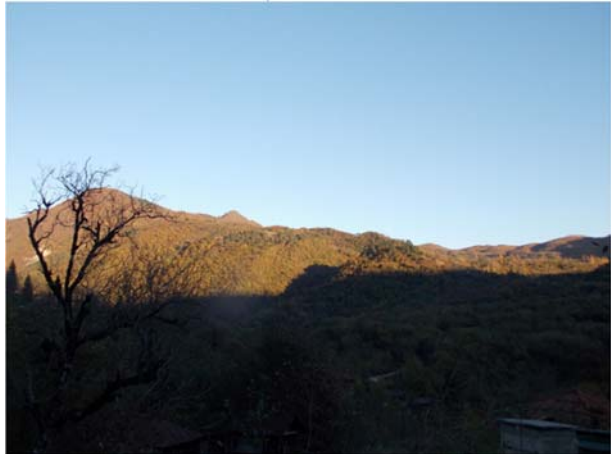
ეგხ-ის დერეფანი სოფ. დღნორისის მიდამოებში