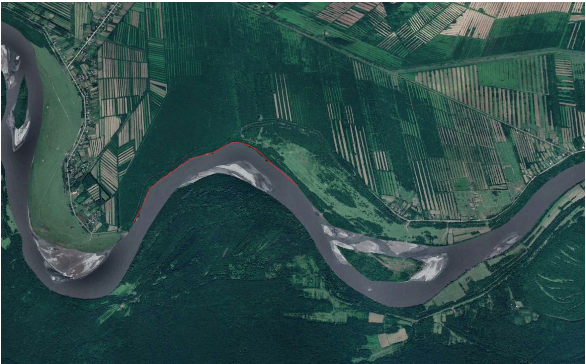
ნახ.1 მდ. რიონის ეროზიული მარჯვენა ნაპირი

როგორც უკვე აღინიშნა დამკვეთის მოთხოვნით საპროექტო ეროზიის საწინააღმდეგო ნაგებობა გაანგარიშებულია 3 % უზურუნველყოფის წყლის ხარჯზე.