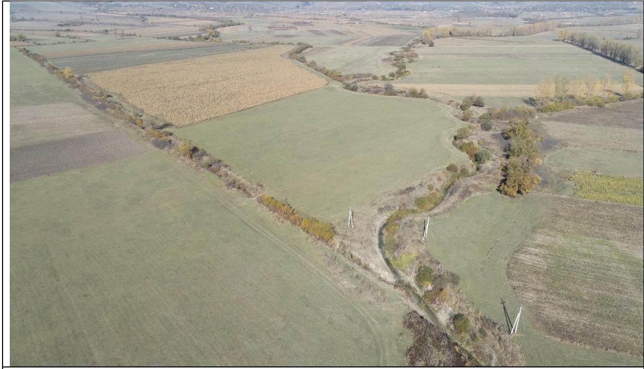
სურათი N1. შერჩეული ტერიტორიის ფოტომასალა